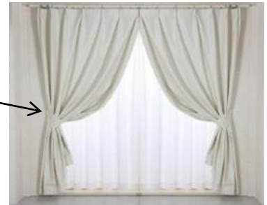
来客がある日・時間に余裕がある日

「この程度のオシャレで満足していいのかなあ...」と思った時にカーテンをまとめる小物(タッセル)で簡単に演出ができることを“皆さんに知っていただこう!!”思いました。