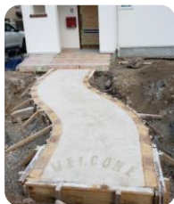
スタンプで模様付け