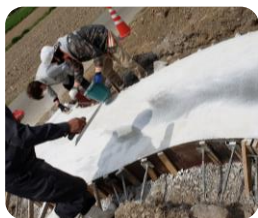
コンクリートへ色付け